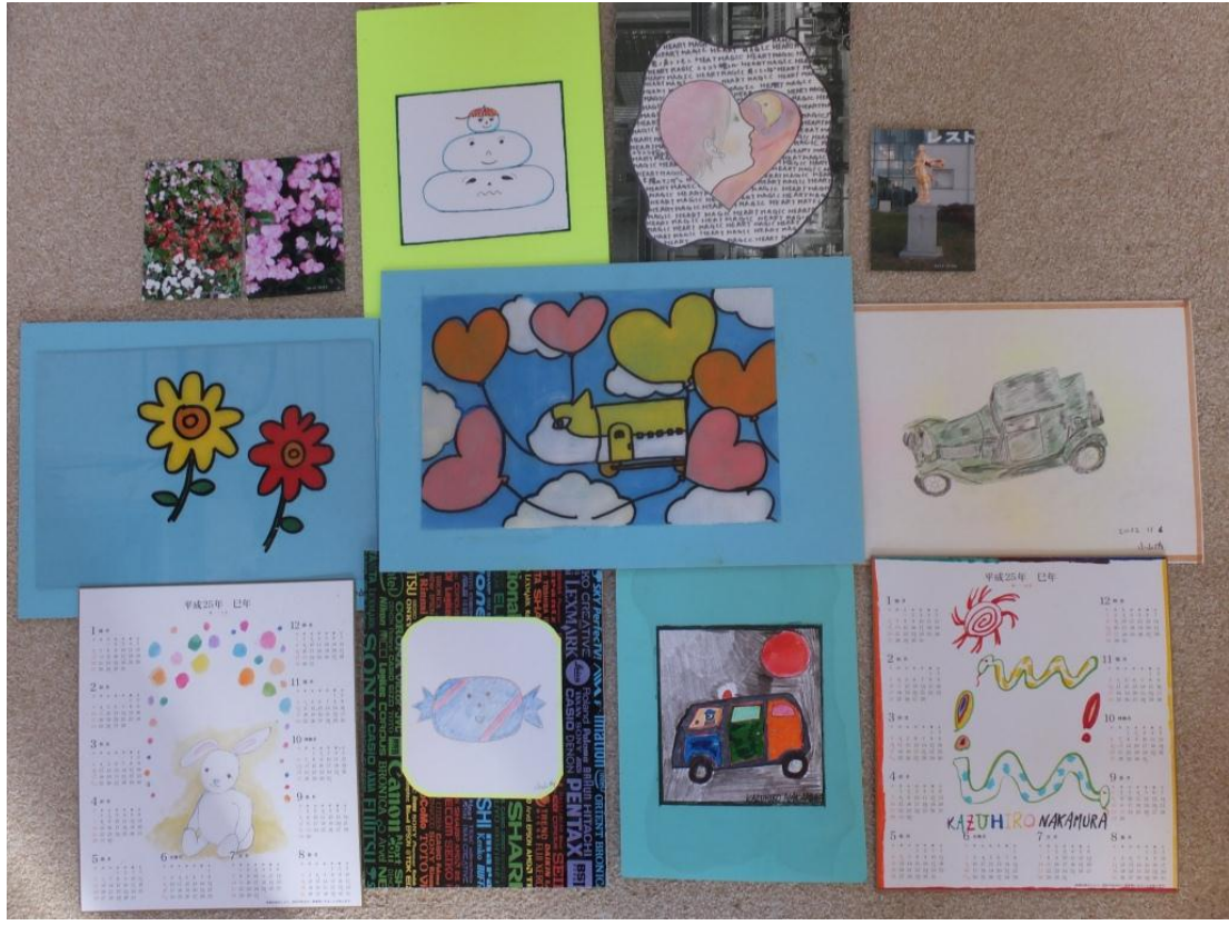
アトリエこすもす 絵てがみ教室作品展に出展する作品の一部です。