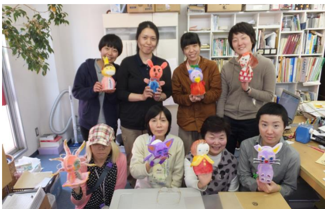
絵画教室のメンバーと一緒に