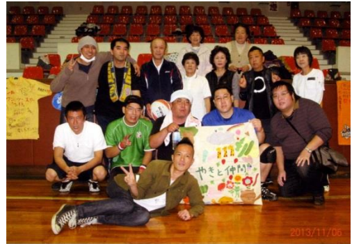
11/6 ディライトフルフェスティバル!