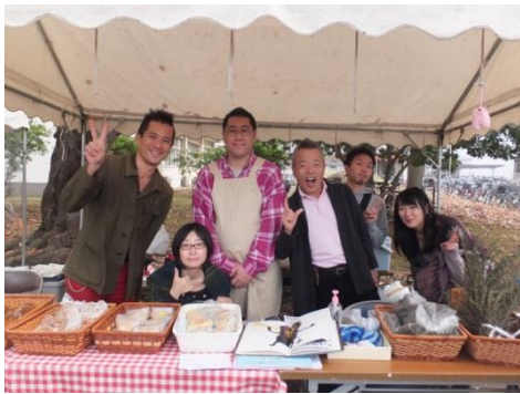
11/3 大学祭でパンは完売!