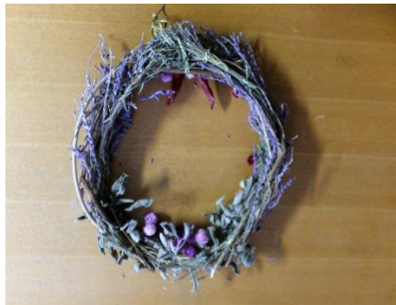
11/16 第三土曜市に出品したハーブのクリスマスリース