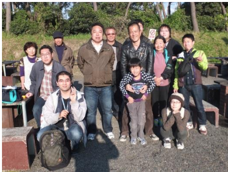
11/17 稲毛海岸にて BBQ!