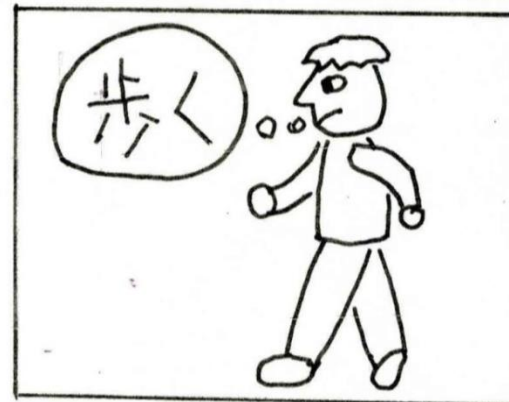
作：小山内 文男さん