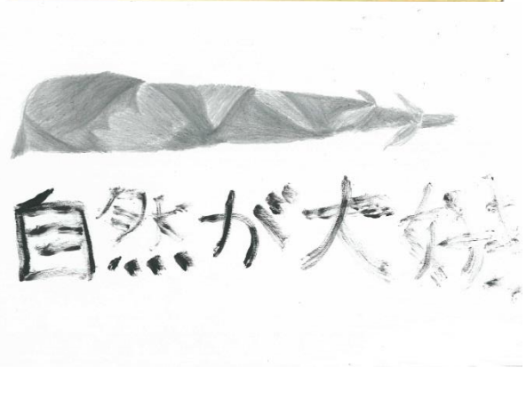
6 月 20 日 絵画の時間の作品