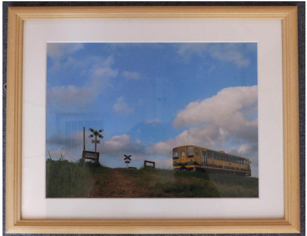
写真 「のどかな屋さがり」 齋藤 毅