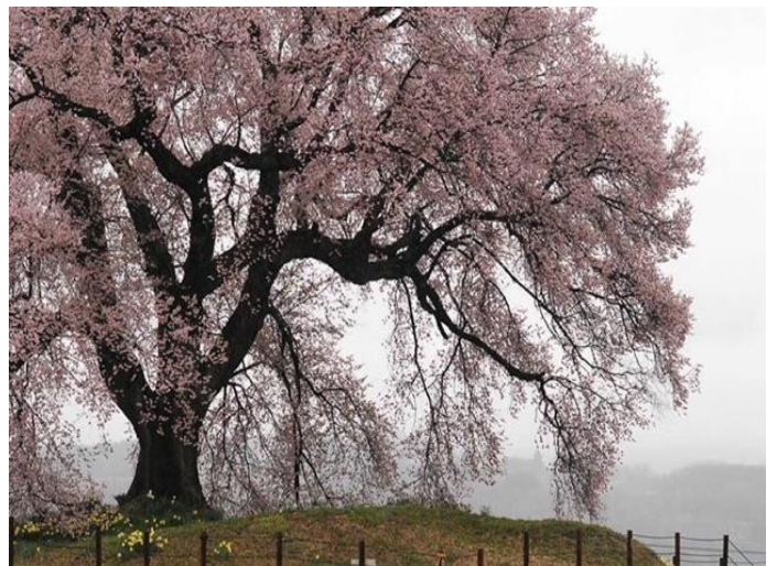
『雨滴るわに塚の一本桜』