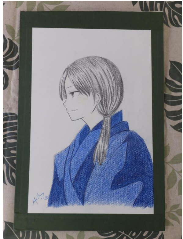
絵画の時間の作品