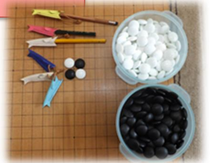
レザークラフトのめざし鉛筆キャップ