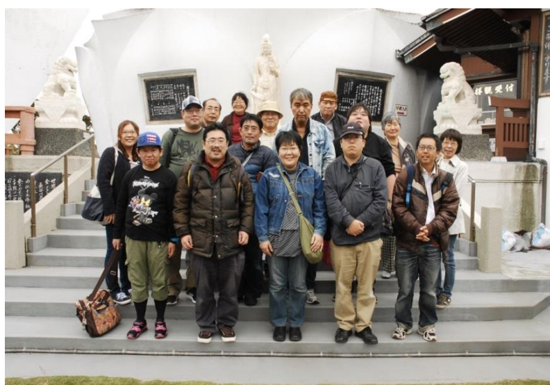
観音様前で記念撮影。その後観音様胎内を拝観しました。