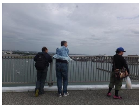
木更津湾の中の島大橋を渡る