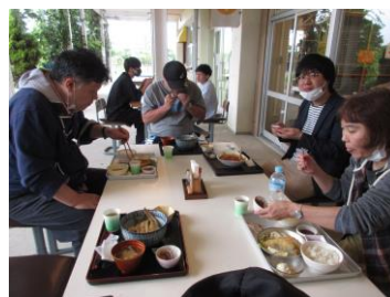
なつかしの給食ランチ