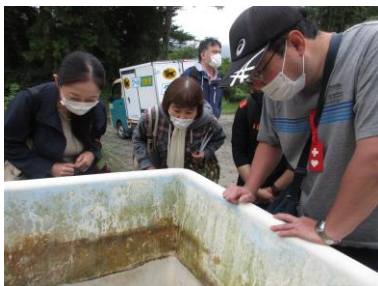
大きな亀にビックリ