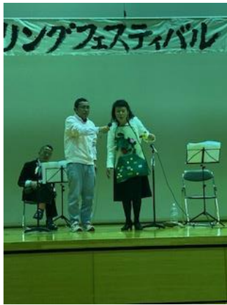
自然とニコニコ エプロンシアター