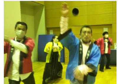
楽しんだもん勝ち！ ソーラン節