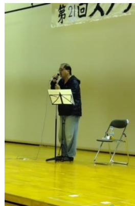
ソロ歌唱 かっこよかった！